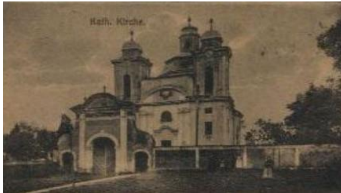
Katholische Kirche zu Freyhan I

so lange vor, dass ich hier selbst als Kind barfuß heruntollte. Nun ist schon eine neue Kindergeneration vorhanden.