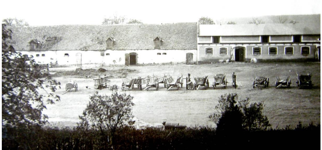
der Wirtschaftshof mit Wagenpark, links die Kuhställe, rechts die Pferdestallungen